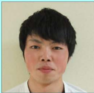
しょうほう たいち